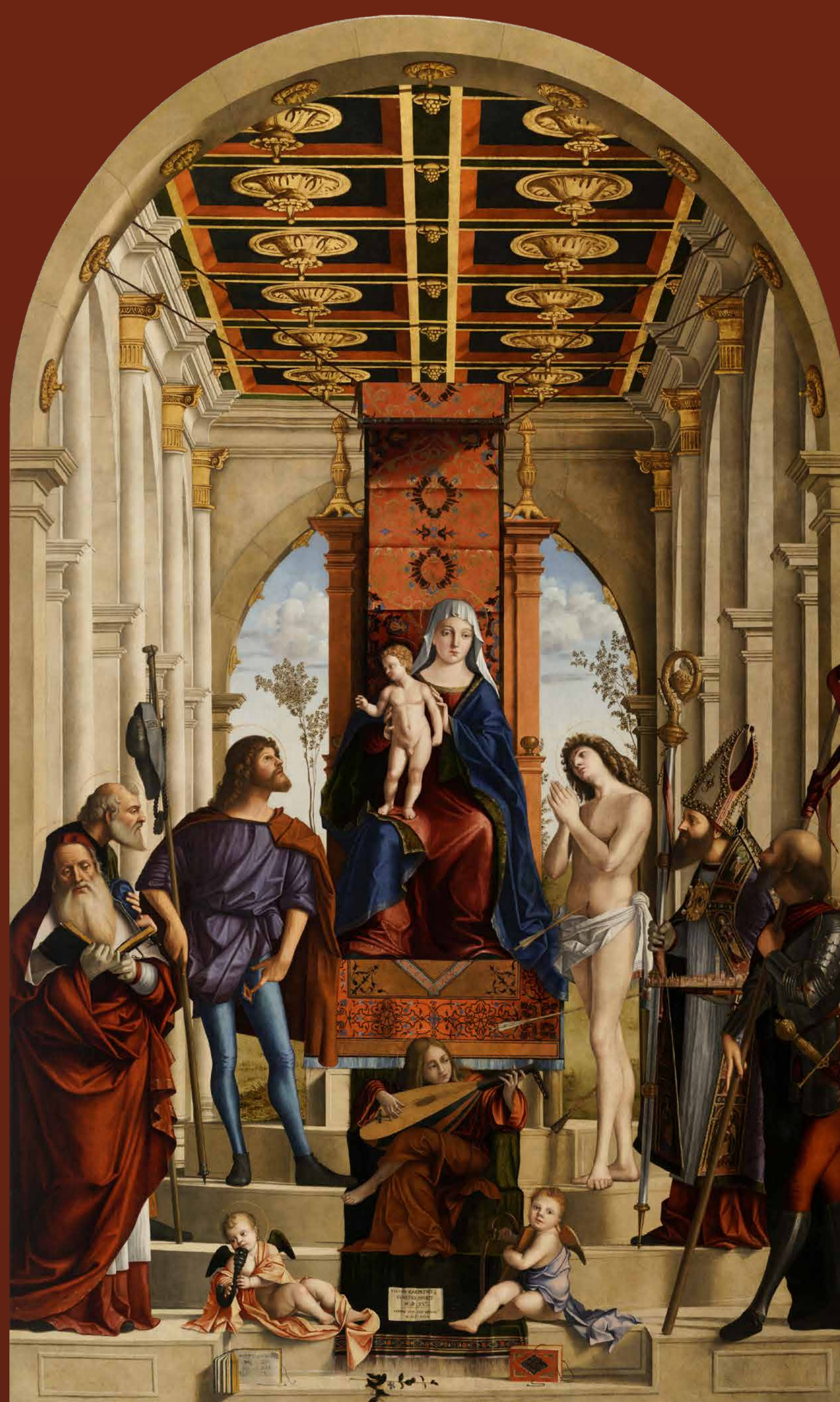
Stanje slike po zaključenih posegih.