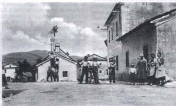
TRNJE (S. Pleho del Cerak)

Trnje: Kamniti križ. Na vasi v tridesetih letih 20. stoletja, ko je stal sredi nedotaknjenega kvalitetnega vaškega ambienta. - Original razglednice je zasebna last, Pivka.