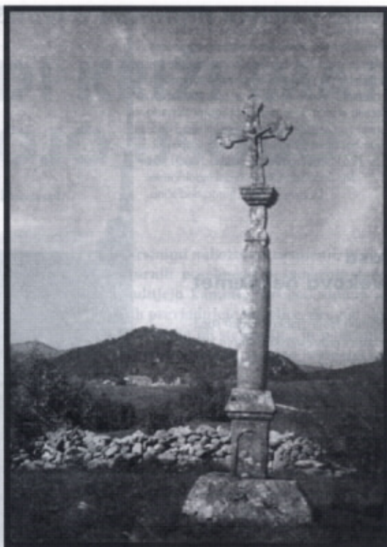
Stara vas: Nekdanji kamniti križ pred vasjo ob stari poti v Postojno. Na sliki je v ozadju hrib Sovic. Pod njim je videti postojnsko gimnazijo. - Fotografijo je posnel septembra 1935 Franc Likan iz Stare vasi. Križ hranijo Deklevovi in Sajovcovi v Stari vasi.

Opisani primeri stanja in ogroženosti kamnitih križev opozarjajo na potrebo