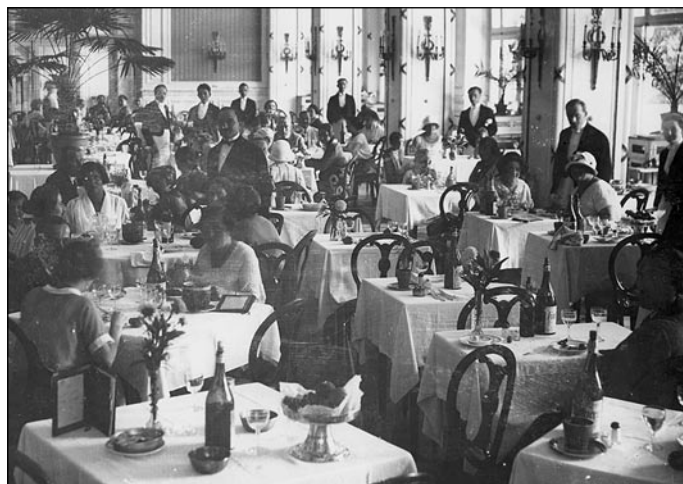
Kristalna dvorana nekoč