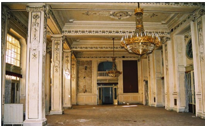
Ostarek nekdanjega blišča Kristalne dvorane

natančno izrezanih šablon, s katerimi so mojstri nanašali apneno štuko maso. Ob oceni stanja je bilo ugotovljeno, da je velik del štukaturnega okrasja slabo pritrjen na podlago zaradi zarjavelih sider, posamezni deli pa razpadajo zaradi izpiranja veziva v štukaturni masi.