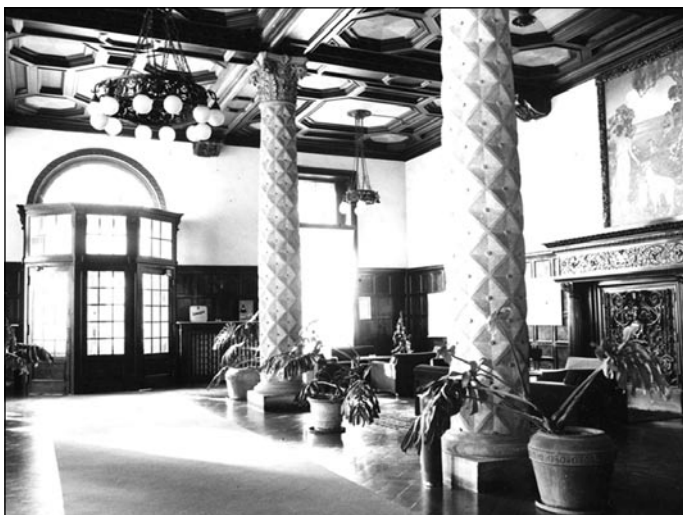
Recepcija v zlatih časih hotela

nalnih sestavin, ki je posledica preobširnih gradbenih rekonstrukcij, neposredno vpliva na znižanje vrednosti spomenika. V primeru, da bi s štukaturami bogato okrašeno hotelsko dvorano spremenili v dolgočasno halo brez okrasja, bi s tem znižali tudi ceno storitev, ki jih ponuja hotel. Zato je cilj restavratorskega poseganja v sestavine arhitekture ohraniti pristnost in s tem vrednost spomenika. Restavratorska dela, ki so v stavbah, kot je palača hotela Palace, izjemno obsežna, ne dovolijo posplošnega pristopa, temveč morajo temeljiti na predhodnih raziskavah, dogovorjenih tehnologijah restavratorskih posegov in izmerjenih količinah, ki so sestavine konservatorsko-restavratorskega projekta.