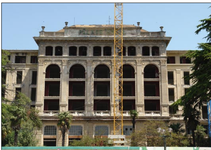
Začetek sanacije hotela Palace (posnetek 26. 6. 2006)

Potrebna konservatorsko-restavratorska dela na fasadi bodo tako obsegala konserviranje ohranjenih elementov, demontažo nestabilnih elementov, odstranjevanje neustreznih dopolnitev, starih zarjavelih kovinskih sider, modelacijo in domodelacijo manj-