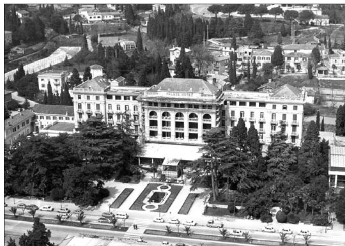
Palace hotel pred desetletji

Zanimivo in nasprotno od današnjih predstav turistične dejavnosti je, da so bili tovrstni hoteli grajeni predvsem kot zdravilišča, ki so skozi celo leto gostom nudila zdravo naravno okolje in mirno bivanje. Da je bilo bivanje gostov v hotelu Palace na ekskluzivno visoki ravni, nam potrjujejo ne le njegova razkošna oprema, temveč tudi družabni prostori: spre-