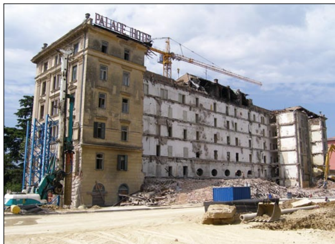
Zadnja stran hotela Palace

Po neuspešnih poizkusih obnove hotela Palace v osemdesetih in devetdesetih letih prejšnjega stoletja je končno dozorel čas, ko se k obnovi pristopa z zavestjo, da je to naš edini in