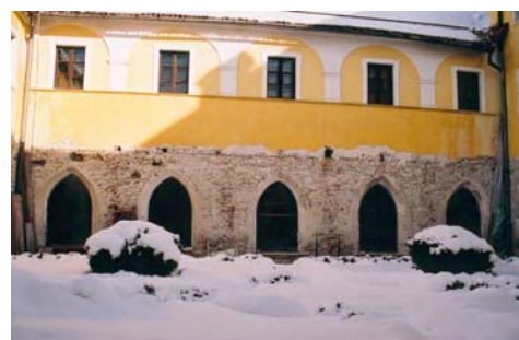
Rekonstrukcija romanske zasnove križnega hodnika in severna fasada z vidno linijo prvotne etaže križnega hodnika ter opečnih polnil ( na mestih odstranjenih opornikov) med okni.