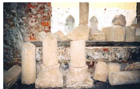
Študija predelave bifore v šilastoločno okno in najdbe romanskih kapitelov, stebričev in baz