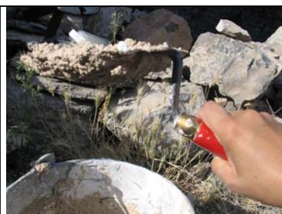
Malta mora biti tako mastna, da obstane na obrnjeni žlici.