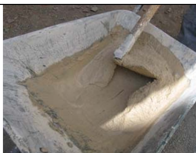
Malta 1:3 iz gašenega apna