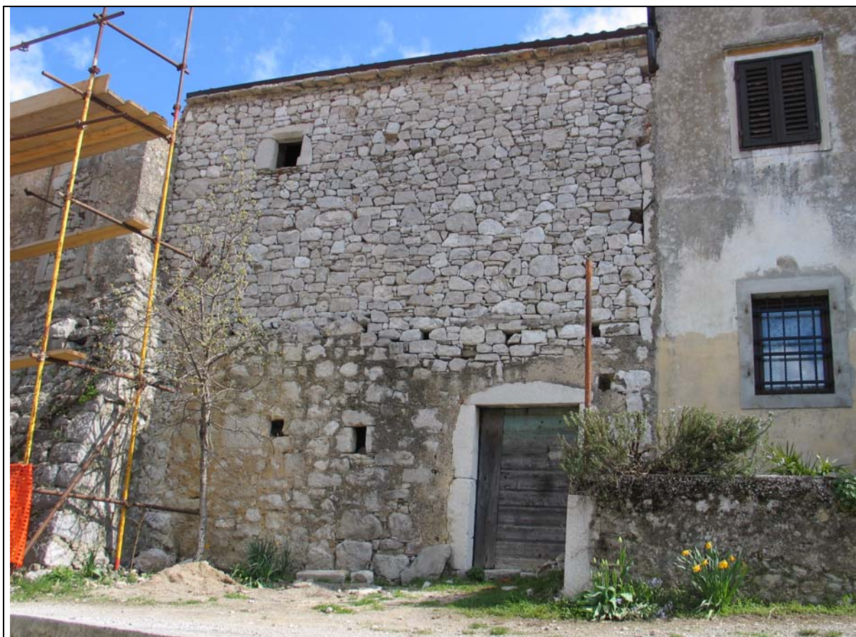
Primer fasade na gospodarskem objektu hiše Pilat