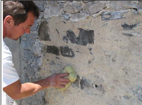
Čiščenje kamnov z gobo