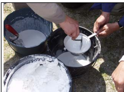
Gašeno apno precedimo če ima grudice