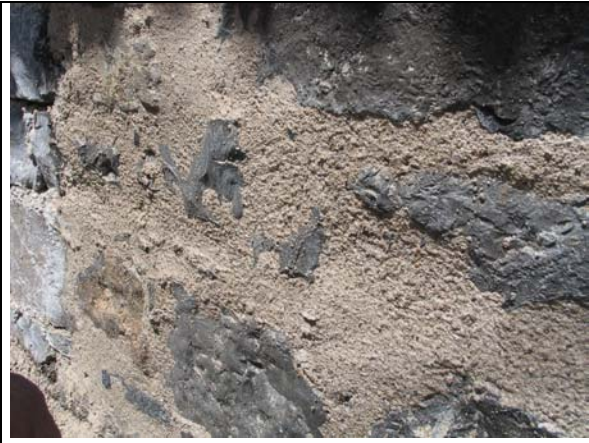
Enakomeren vzorec vidnih kamnov v zidu